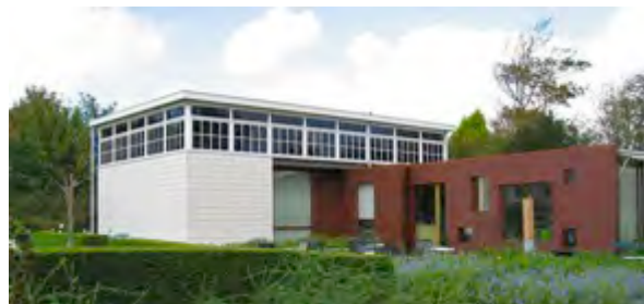
Het oude Kunstzaaltje, ICAEC CFVV.