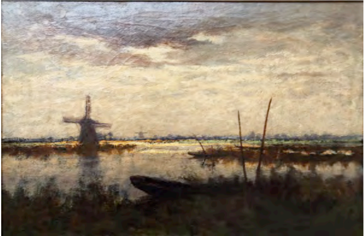
Paul Gabriël, Hollands polderlandschap, z.j. , olieverf op doek, ICEAC CFVV.

Er zijn fraaie etsen van Willem Witsen, ik herkende een polderlandschap van Paul Gabriël, er is een mooi schilderij van Norderney.