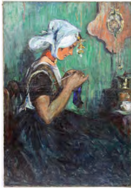
Jan Toorop op het strand, vermoedelijk in Katwijk. MTVP Museum Domburg. Armand Jamar, La Zélandaise , 1911, olieverf op doek, ICEAC CFVV.

Voor en tijdens de Eerste Wereldoorlog zochten ook buitenlandse kunstenaars een toevlucht in Domburg. Zo ontstond een internationaal netwerk van contacten. Zeeuwse voorstellingen zijn goed vertegenwoordigd.